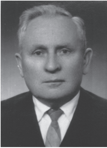
1 pav. Izidorius Liesis 1901–1993 m. Fig. 1. Isidorius Liesis (1901–1993)