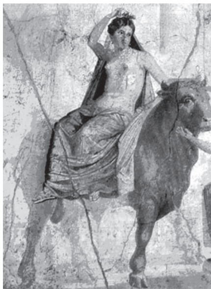
Bild 2. Die Europa auf dem Stier. Wandfresko aus Pompeji/Italien

Gemeinschaft verwendet. Wegen der Trennung von Europäischer Union und Europäischer Gemeinschaft wird aber andererseits auch zwischen Gemeinschaftsrecht und Unionsrecht im engeren Sinne unterschieden. Das Recht der Europäischen Union und der Europäischen Gemeinschaften besteht aus Primär- und Sekundärrecht; besondere Bedeutung hat daneben die Rechtsprechung des Europäischen Gerichtshofs.