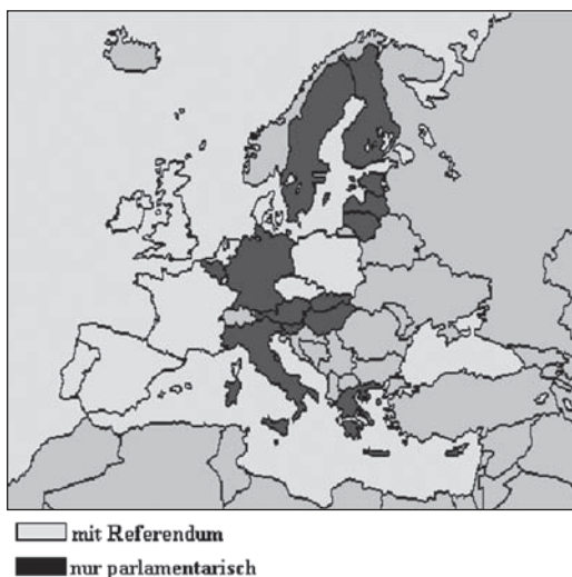
Bild 4. Ratifikation der EU-Verfassung

43 %. Während in Litauen 2004 die Wahlbeteiligung mit 48 % noch 3 % über dem Europadurchschnitt lag, sank sie 2009 auf enttäuschende 21 %. Das ist umso weniger verständlich, als Litauen den Entwurf für eine Europäische Verfassung 2005 bereits ratifiziert hatte, als dieser nicht einmal im Amtsblatt der Europäischen Union veröffentlicht war. Erst nach der Ratifikation wurde öffentlich bekannt, dass der ins Litauische übersetzte Verfassungstext 400 Übersetzungsfehler enthielt. 17