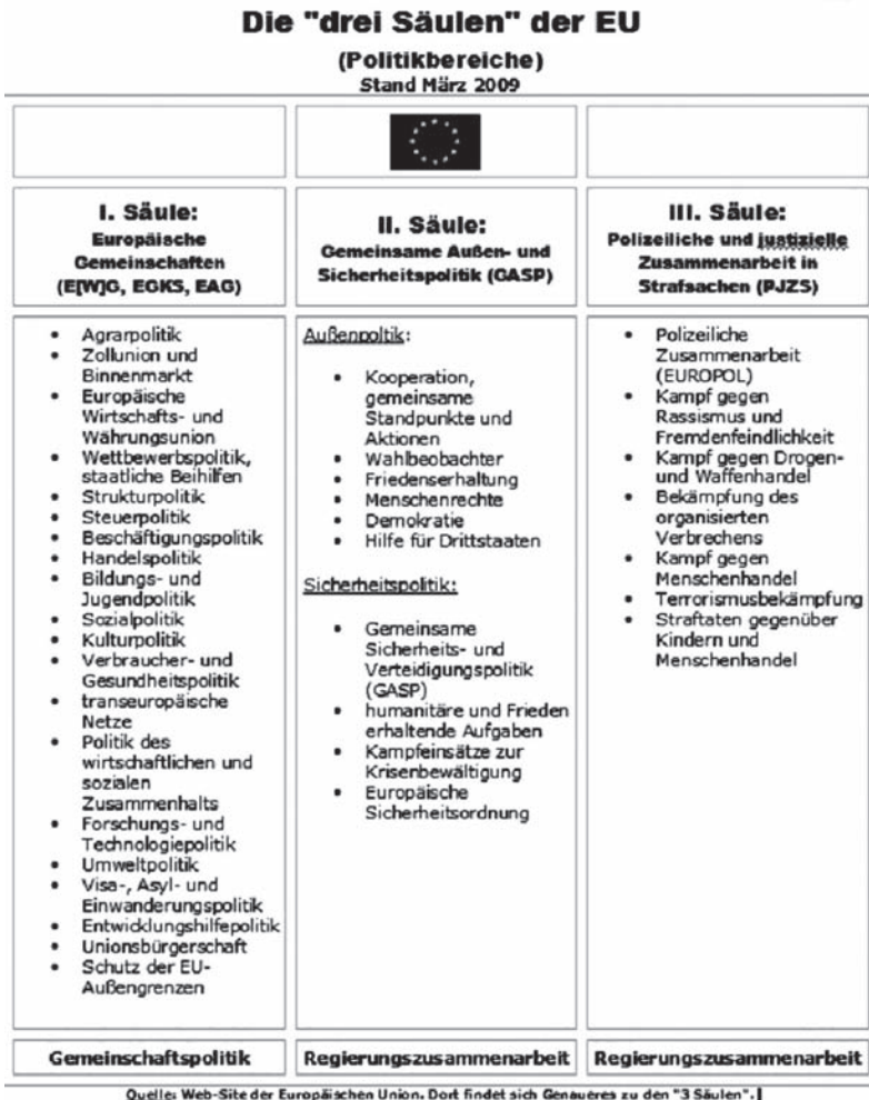
Bild 3. Die „drei Säulen“ der EU (Politikbereiche). Stand März 2009

(Die Zustimmung Irlands wurde in einem Referendum am 2. Oktober 2009 erteilt.) Auch mit der Unterschrift des tschechischen Präsidenten Klaus ist zu rechnen, nachdem wie bei Großbritannien und Polen Zugeständnisse durch die EU-Ratspräsidentschaft signalisiert wurden.