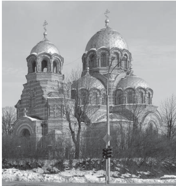
2 pav. Vilnius. Dievo Motinos Dangaus Ženklo (Znamenskaja) cerkvė.

Fig. 1. Orthodox Church of St. Catherine in Vilnius.