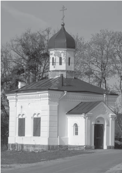
1 pav. Vilnius. Šv. Kotrynos cerkvė.

Naujas cerkvių statymo Vilniuje etapas prasidėjo XIX a. pabaigoje–XX a. pradžioje. 1892–1895 m. pastatyta Mykolo Arkangelo cerkvė Šnipiškėse, dabartinėje Kalvarijų gatvėje (architektai V. S. Merežkovskis ir Michailas Prozorovas), 1895–1898 m. – Aleksan-