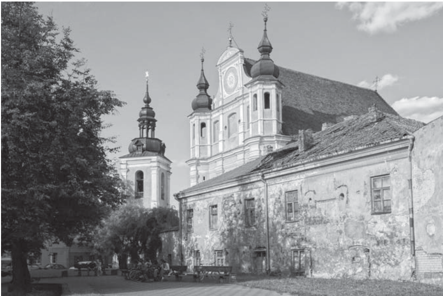
5 pav. Vilnius. Šv. Mykolo bažnyčia. Fig. 5. Catholic Church of St. Michael in Vilnius.

XX a. pradžioje taip pat buvo restauruota Šv. Mykolo bažnyčia Vilniuje (5 pav.). Bažnyčia pastatyta XVI a. pabaigoje–XVII a. pradžioje Lietuvos Didžiosios Kunigaikštystės kanclerio ir Vilniaus vaivados Leono Sapiegos (Leon Sapieha, 1557–1633) iniciatyva. Panašiai kaip ir kitų Lietuvos ir Lenkijos tuo metu statytų sakralinių pastatų jos architektūra turi gotikos ir renesanso bruožų. Bažnyčia tarnavo vienuolėms bernardinėms (klarisėms) ir kartu buvo Sapiegų šeimos mauzoliejumi. Jos požemiuose buvo palaidota daug šios garsios didikų giminės atstovų. Bažnyčia ir vienuolyno pastatai labai nukentėjo 1655–1661 m. karo su Maskva metu, kada įsiveržę kazokai išžudė vienuolyne prisiglaudusius žmones kartu su nespėjusiomis pasitraukti vienuolėmis. Po 1662 m. Lietuvos Didžiosios Kunigaikštystės etmono ir Vilniaus vaivados Povilo Jono Sapiegos ir kitų aukotojų lėšomis bažnyčia ir vienuolyno pastatai buvo atnaujinti ir vėl atiduoti vienuolėms, kurios globojo ir auklėjo mergaites, dažniausiai neturtingas bajoraites: mokė jas religijos pagrindų, rašybos, skaitymo, muzikos, prancūzų kalbos, rankdarbių (Ener 1908; Zahorski 1911; Lietuvos architektūros... 1994: 263–264).