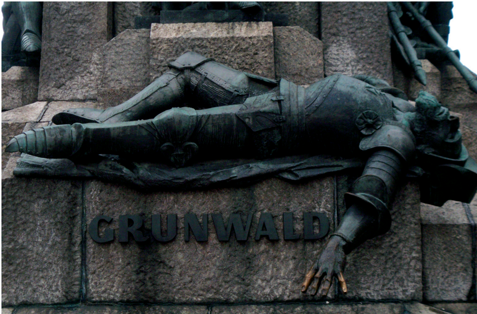
2 pav. Krokuvą. Žalgirio paminklo fragmentas. Kryžiuočių ordino magistro Ulricho von Jungingeno figūra.