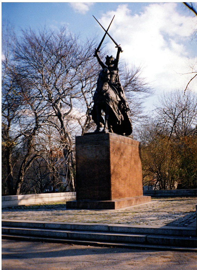
3 pav. Niujorkas. Karaliaus Jogailos paminklas. Fig. 3. New York. Monument of the King Jagiello.

„ponų“ minioje. Kaip jie jautėsi, nemoku pasakyti. Gal tikrai buvo persiėmę vaidinama role komedijoje „Broliavimosi ponų su liaudimi“. Tą valandą gal būti. Bet vėliau turės susiprasti, sulyginti kasdienius santykius su visiška stoka jungės „viršų su apačiomis“. Tuomet supras, jog muzikai kai kada tereikalingi ponams dekoracijai, vien dėlto, kad turi varsotas sermėgas; tereikalingi daugiau poezijoje, kaip gyvenime ir politikos darbe“ (Tumas 1910b: 1). Vilniečių kolegų sukritikuotas už neobjektyvumą, Tumas, rašydamas apie Krokuvos iškilmes, vėliau sušvelnino toną, tačiau visiškai neatsisakė lietuvių tautinio judėjimo dešinesiems veikėjams būdingo klasinio įtarumo ir priešiško „ponų Lenkijai“ ir jos kultūrai (J. H. 1910 101: 1; Tumas 1910a). Iš tikrųjų Austrijos valdomoje Lenkijos dalyje visuomenės demokratėjimo procesas vyko žymiai sparčiau negu prijungtoje prie Rusijos imperijos Lenkijos Karalystėje ar represijų gniuždomame Šiaurės vakarų krašte, apimančiame užgrobtas lietuvių ir baltarusių žemes (Czubiński 2000: 9–27, 41–51).